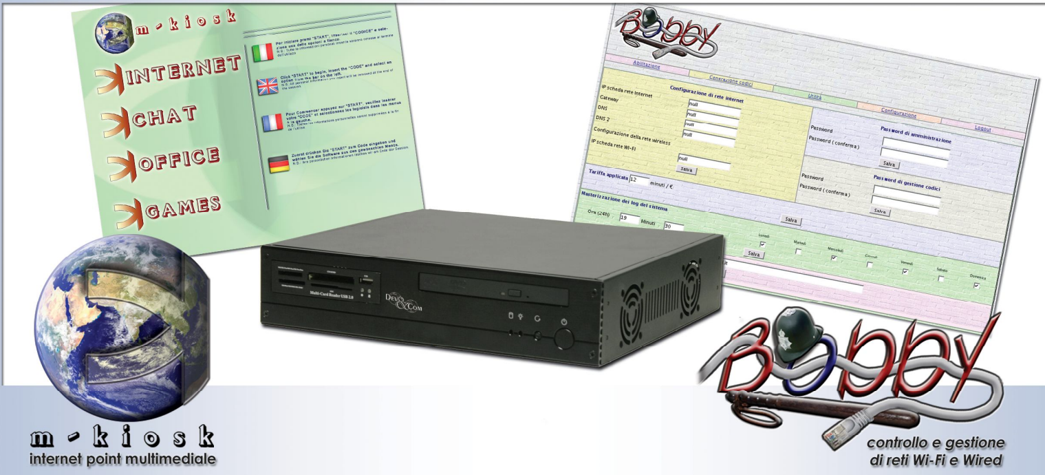
m - kiosk internet point multimediale